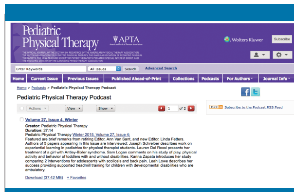
Figura 4. Podcasting de la revista Pediatric Physical Therapy

Entre las aplicaciones más populares de los podcasts se encuentran la televisión y la radio (la mayoría de programas de radio emiten la totalidad de sus contenidos), las entrevistas (posibilidad de recibir las entrevistas completas en el podcasting de un programa), las aplicaciones educativas y la formación abierta y a distancia. Es precisamente en el ámbito educativo en el que el uso del podcasting está suponiendo un gran avance. La inclusión de podcasting como soporte para la docencia reglada ha supuesto una mejora en el proceso de aprendizaje. En un estudio realizado por Evans 20 quedó reflejado que el grupo de estudiantes universitarios que realizó el estudio opinaban que los podcasts eran herramientas de revisión más efectivas que los libros de texto y que podían ayudarles más que sus propias notas a la hora de aprender. Además, también indicaron que eran más receptivos al material docente en forma de podcast que a los libros de texto y a las clases magistrales. Combinado con las ventajas de la flexibilidad respecto a cómo, cuándo y dónde puede ser empleado, el podcasting aparece como una herramienta innovadora de aprendizaje con un potencial significativo para adultos