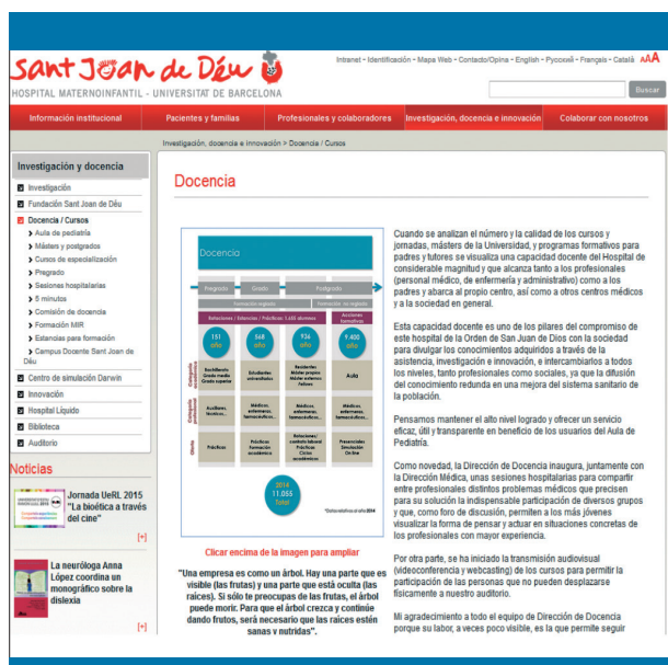
Figura 2. Oferta de formación a profesionales a través de webcasting del Hospital Materno Infantil Sant Joan de Déu ( http://www.hsjdbcn.org/portal/es/web/docenciaCursos )

aceptación no sólo entre estudiantes, sino también entre grupos de profesionales que los emplean para la mejora y actualización de sus competencias 14 o para dar solución a una alta demanda de información y docencia. Es el caso del Hospital Materno Infantil Sant Joan de Déu (figura 2), que emplea este recurso para la formación y difusión de conocimientos, tanto de su personal médico y administrativo como para padres, otros centros de similares características y la sociedad en general.