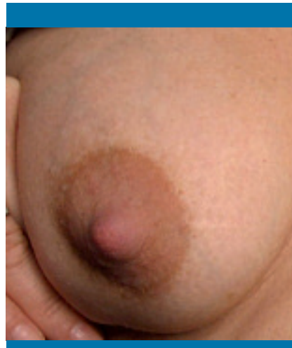
Figura 3. Mastitis por Staphylococcus epidermidis en la que la apariencia del pecho afectado es normal

completamente, lo que provoca una retención de leche que empeora los síntomas locales (dolor, endurecimientos focales) (figura 4). Cuando la obturación se produce en alguno de los conductos que drenan al exterior en el pezón, se puede llegar a observar a simple vista, ya que la leche fluye por un número menor de poros que en condiciones normales. En ocasiones, estas obstrucciones forman unas estructuras características, integradas por calcio y bacterias, conocidas como «ampollas de leche». Conviene recordar que el calcio es un elemento que fomenta la formación de biofilms y, obviamente, la presencia de este catión en la leche es tan inevitable como imprescindible para el correcto desarrollo del niño. Desde el punto de vista práctico, los niños pueden mostrarse más irritables o nerviosos durante el amamantamiento, ya que les cuesta bastante más esfuerzo y tiempo obtener la misma cantidad de leche.