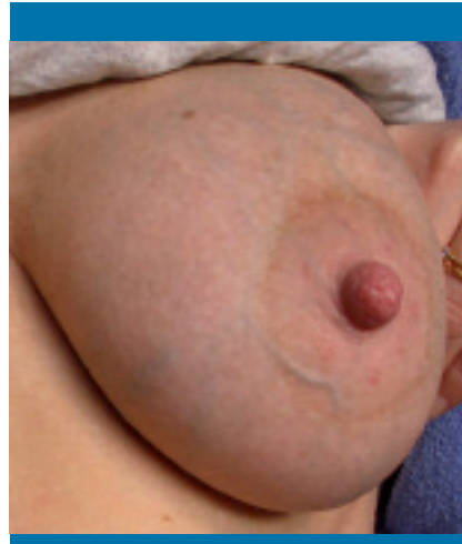
Figura 2. Enrojecimiento del pecho en un caso de mastitis por Staphylococcus aureus

En los libros de texto se suele decir que las mastitis se manifiestan por dolor intenso y signos inflamatorios (enrojecimiento, tumefacción, induración) (figura 2), acompañados de síntomas generales similares a los de la gripe, que incluyen fiebre (>38,5 °C), escalofríos, infartación de ganglios axilares, malestar general, cefaleas, náuseas y vómitos. Sin embargo, estas mastitis «de libro» sólo se observan en aproximadamente un 10-15% de las mujeres afectadas. En la mayoría de los casos, el único síntoma es un dolor intenso en forma de «pinchazos», acompañado ocasionalmente de síntomas locales, como grietas y/o zonas de induración, pero sin afectación sistémica (figura 3). Este hecho confunde frecuentemente el diagnóstico y provoca que se trate de un problema tan infravalorado como infradiagnosticado. El dolor se debe a que las bacterias se disponen en forma de películas biológicas ( biofilms ) en el epitelio de los acinos y los conductos galactóforos. Si la concentración bacteriana rebasa los límites biológicos, la luz de los conductos se reduce, de manera que la presión que ejerce la leche sobre un epitelio que está inflamado es considerablemente mayor. Como consecuencia de ello, cuando se va acumulando la leche en los conductos o cuando se produce la eyección de ésta, se siente un dolor intenso en forma de «pinchazos» (figura 4). En ocasiones, algunos de los conductos se pueden llegar a obturar