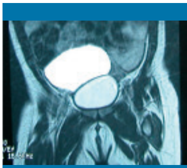
Figuras 1 y 2. Imágenes de resonancia magnética que muestran la estructura quística intraabdominal