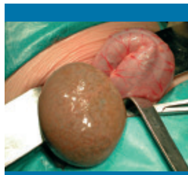
Figura 3. Quiste intraabdominal